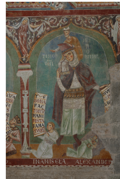
Détail des fresques de l' Anla Gotica (XIII e siècle) Rome, Basilica dei Santi Quattro Coronati

Mutations des sociétés politiques et système de communication (XIII e -XVII e siècle)