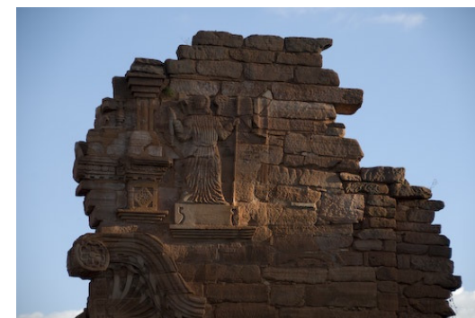
Mission de San Ignacio Mini (Argentine)